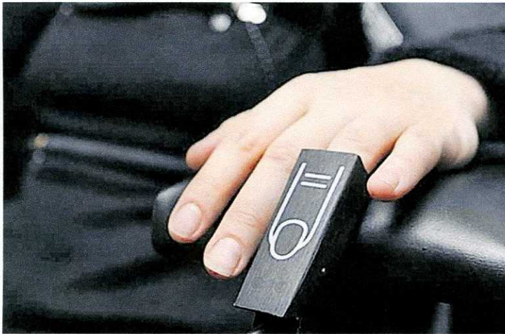
Проверка. Испытание на честность проходит все больше киевлян.

В Киеве новая тенденция — испытывать своих партнеров и клиентов на честность. При этом проверка на детекторе лжи становится все массовее — десятки фирм предлагают подобные услуги. Дошло до того, что хозяева квартир, прежде чем сдать жилье, ведут потенциального квартиросъемщика на детектор лжи. Чтобы потом проблем не было.